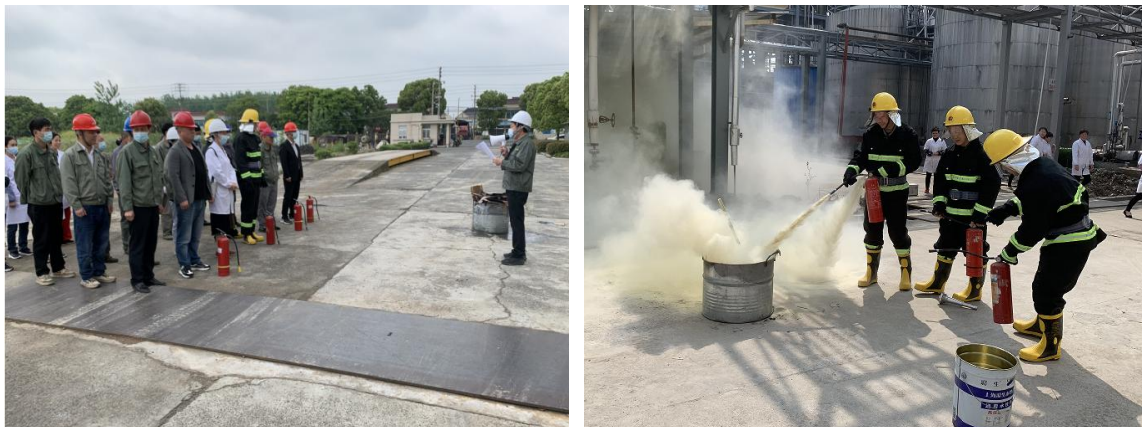
图 6.3-01 消防演练现场

案》等应急预案、《触电事件应急预案》、《重大设备故障应急预案》等应急处置方案等，对火灾、机械、触电等均有相应的应急措施，并成立了应急指挥中心和应急救援专业组。