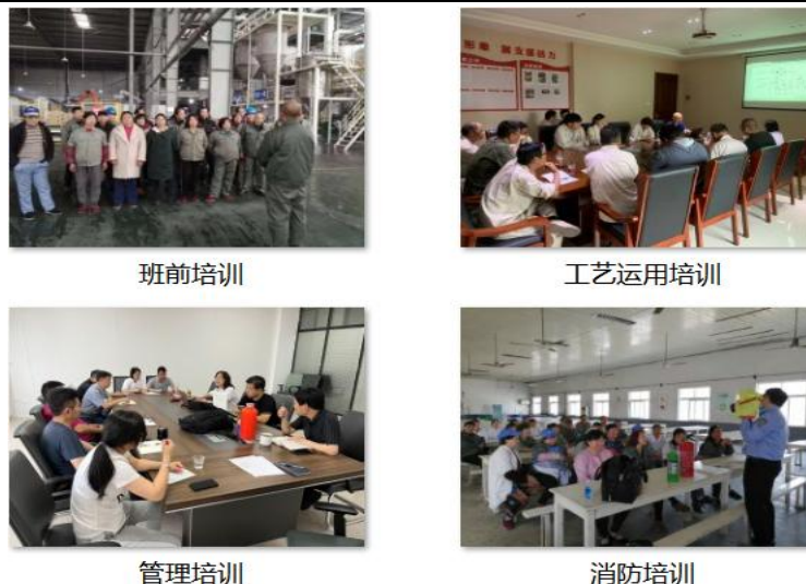
图 3.2-1 各类培训活动

公司每年针对实际和市场形势，识别各部门的培训需求，制定员工培训规划和年度计划，开展职工教育培训，包括质量意识、质量知识、管理制度、专业知识等培训内容。公司每年制定并下发了《年度培训计划》等，对质量诚信教育进行了安排布置。